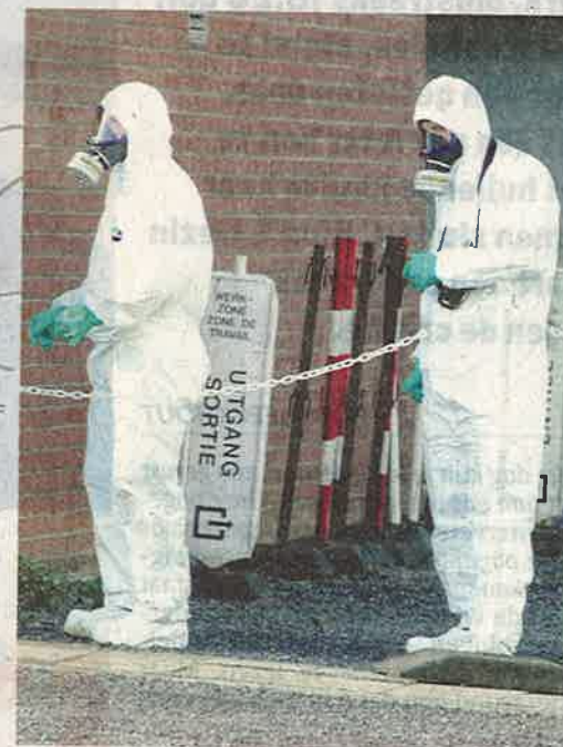
Technici in witte beschermingspakken probeerden het euvel zo snel mogelijk te verhelpen.